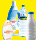
Bouteilles, flacons plastiques