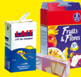
Emballages en carton et briques alimentaires