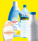
Bouteilles, flacons plastiques