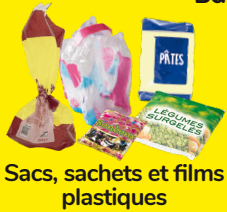
Sacs, sachets et films plastiques