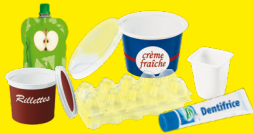
Pots, boîtes, tubes