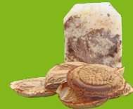
Sachets de thé et marc de café