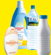
Bouteilles, flacons plastiques