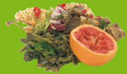
Restes de repas et épluchures de fruits et légumes