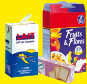
Emballages en carton et briques alimentaires