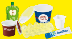
Pots, boîtes, tubes