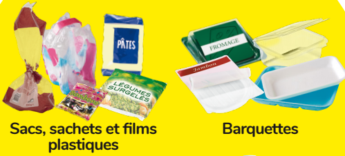
Sacs, sachets et films plastiques